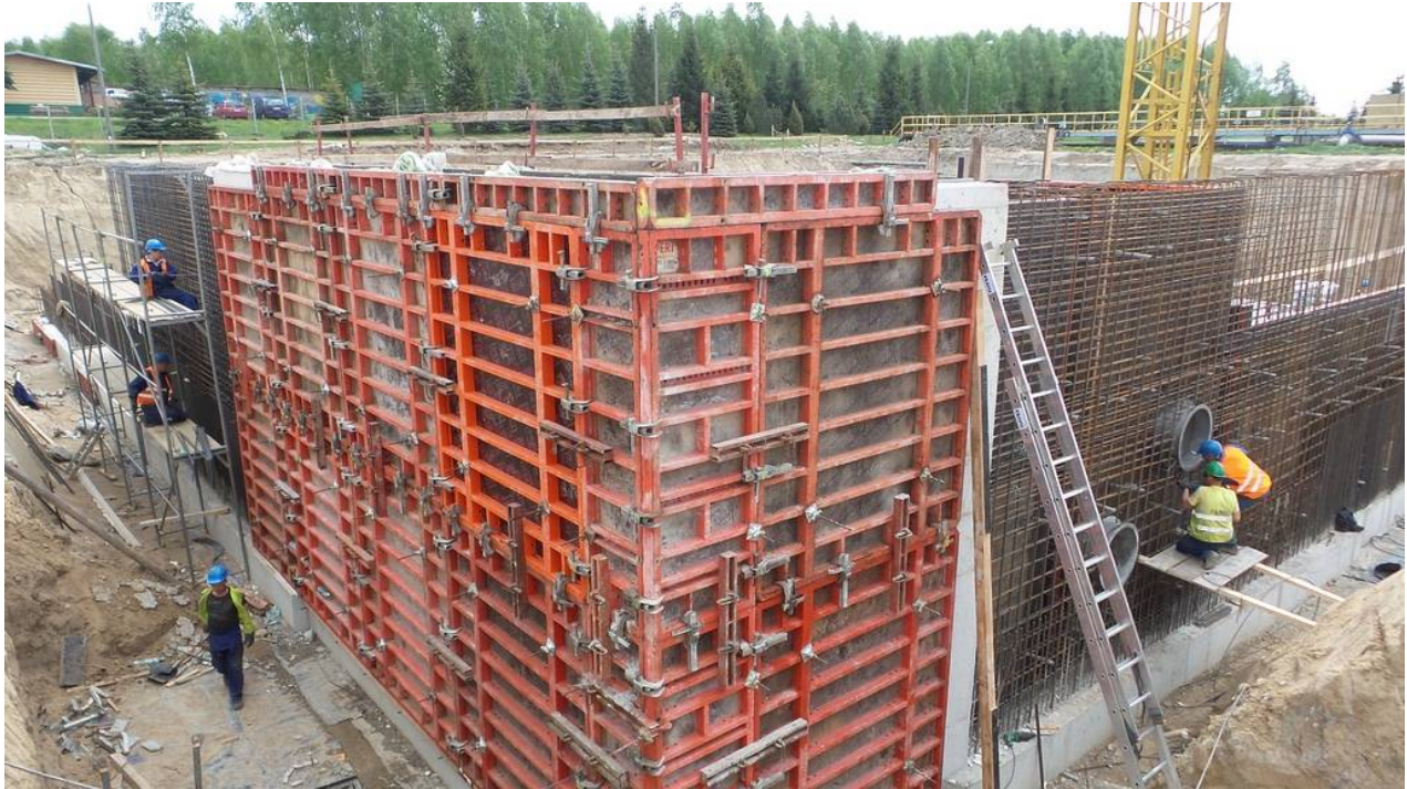
Obiekt nr 39 – Wiata kompostowni.